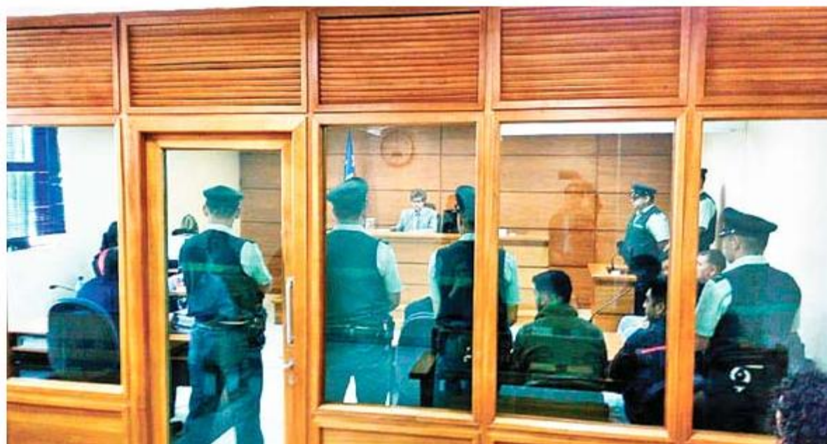
Ayer se realizó el control de detención del imputado en el Juzgado de Garantía de Chillán.

El chillanejo, dentro de la organización delictual, se dedicaba a la receptación de