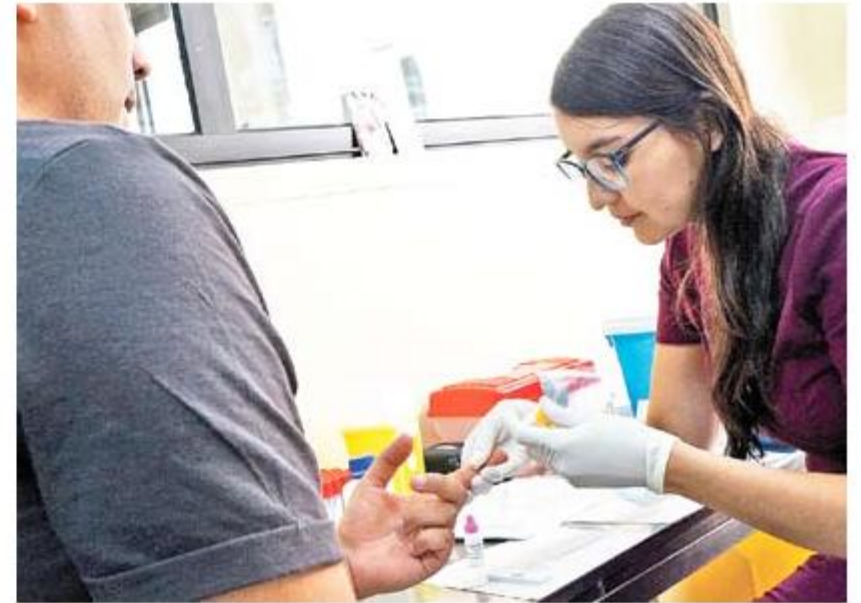
Los jóvenes son los que más se han aplicado el test.

1.008 personas se han tomado el test rápido de VIH en Ñuble, en el marco de la campaña de verano impulsada por el Ministerio de Salud cuyo objetivo es detectar a tiempo casos de la enfermedad y facilitar el acceso al tratamiento.