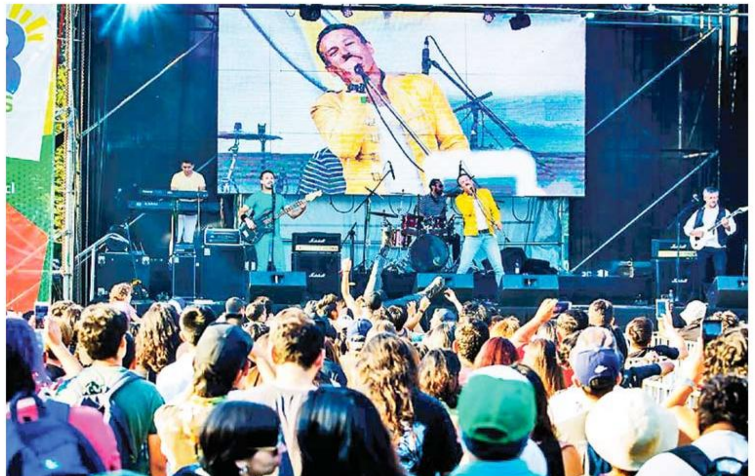
Una de las bandas invitadas este sábado es la temuquense "Royal Band", un tributo a Queen venido desde La Araucanía.

POR: CAROLINA MARCOS *cmarcos@ladiscusion.cl