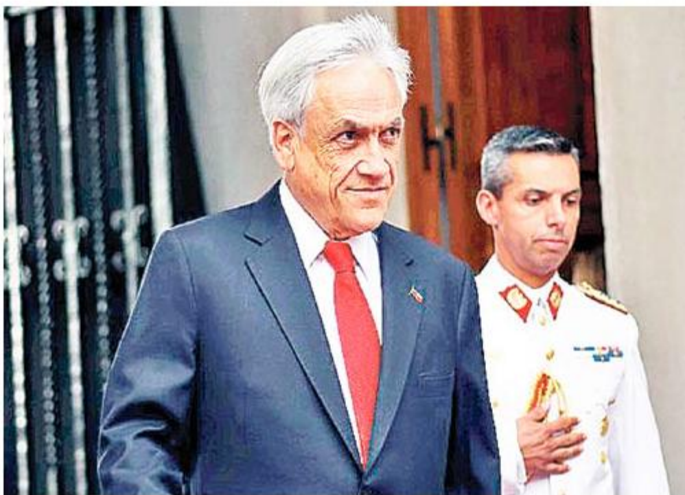
El Presidente adelantó, además, que el costo de la luz aumentará cerca de un 10,5%.

La ministra de Energía, Susana Jiménez, explicó que serán 6,5 millones los medidores inteligentes que serán instalados.