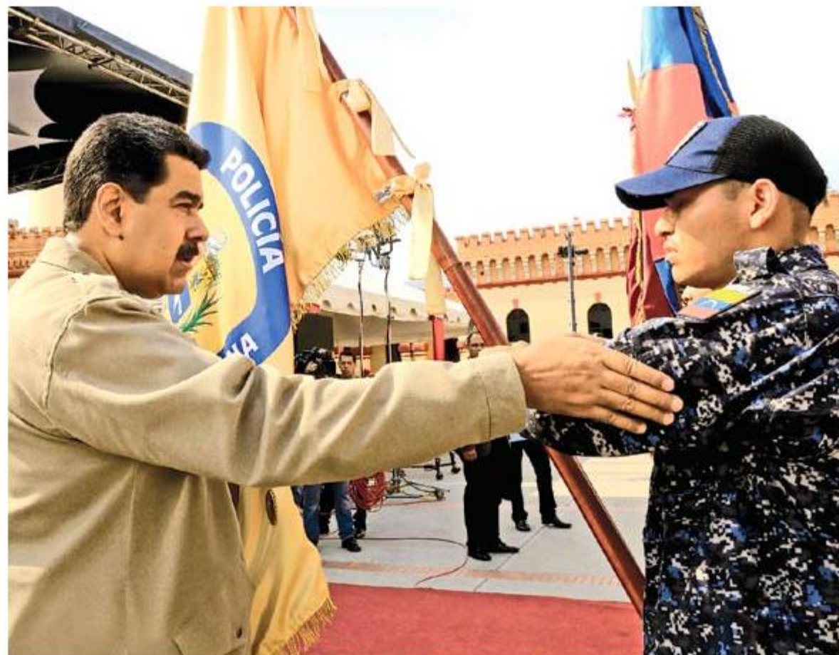
Maduro condecoró a varios oficiales de la Fuerza Armada que impidieron el paso de los cargamentos.

POR: AFP *diario@ladiscusion.cl