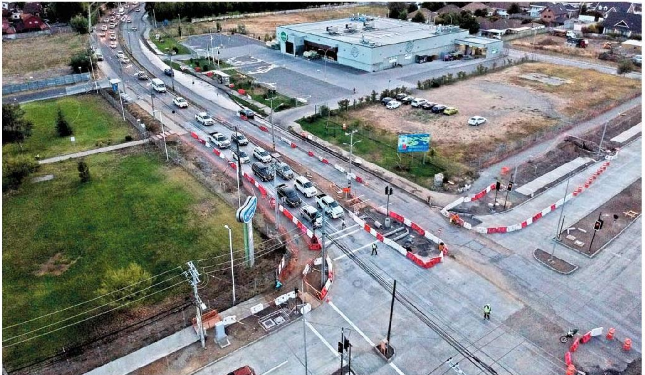
Mientras algunos usuarios reclamaron por la demora, otros dijeron que esta no fue tan grande.

El coronel John Polanco, prefecto de Carabineros Ñuble, puntualizó que "fueron más de 40 los puntos que, por planificación, había que disponer de contingente para el control de tránsito y ellos estuvieron desde las 6.30 de la mañana, hasta las 8.30. Las medidas adoptadas por la Seremi de Transportes y el municipio, fueron las óptimas y gracias