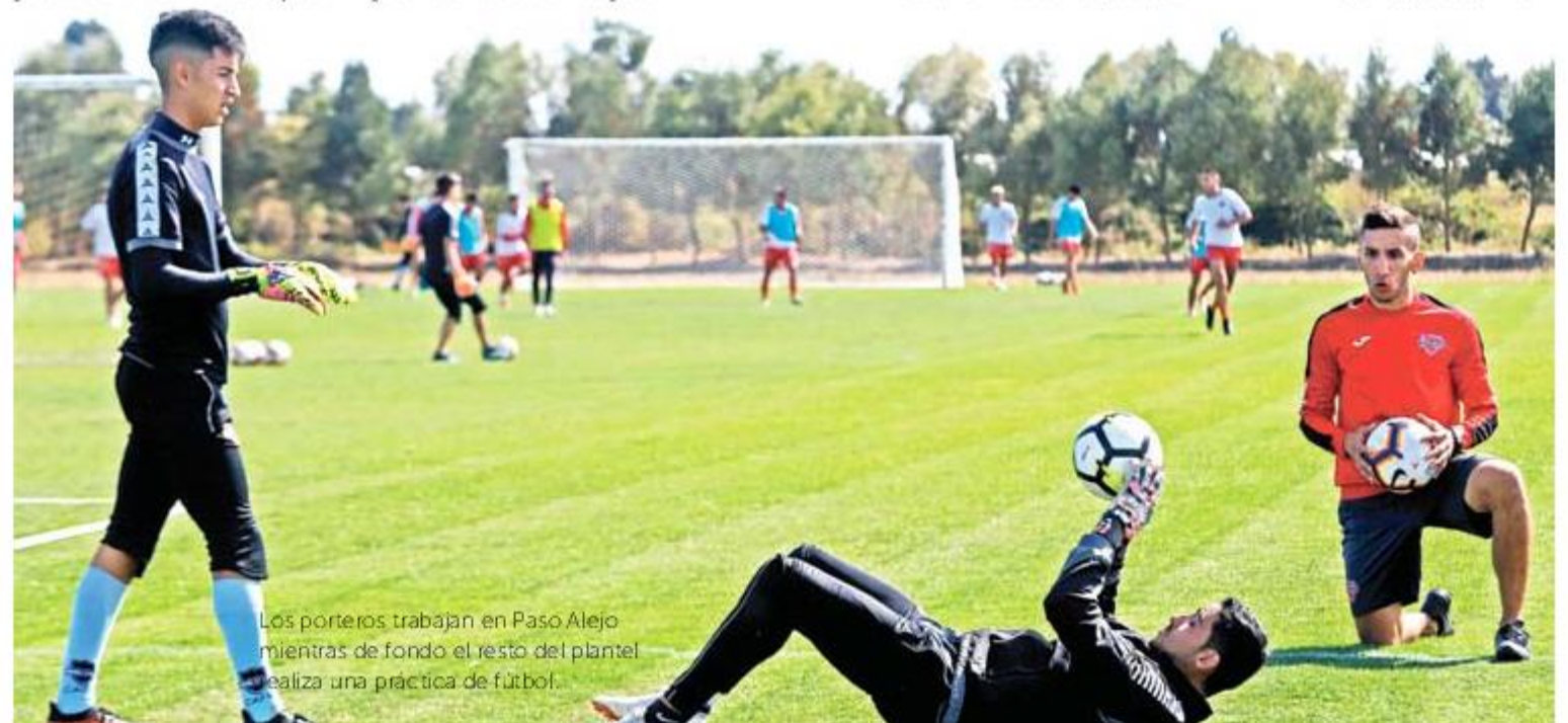
Los porteros trabajan en Paso Alejo mientras de fondo el resto del plantel realiza una práctica de fútbol.