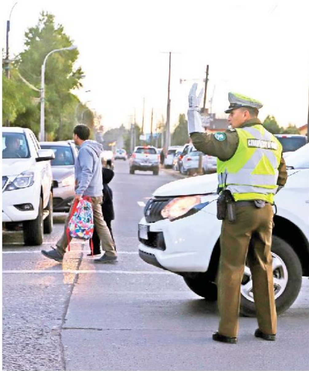
La imagen es histórica, pero las medidas y el apoyo de los usuarios podrían cambiarla positivamente.