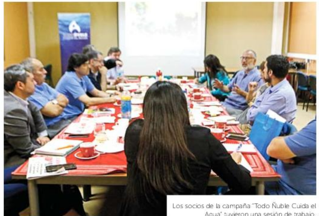
Los socios de la campaña "Todo Ñuble Cuida el Agua" tuvieron una sesión de trabajo.