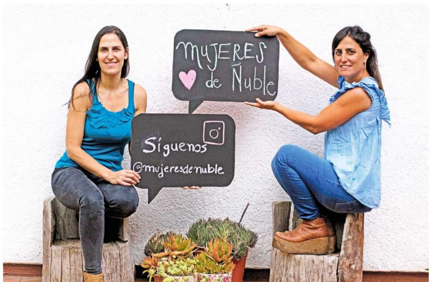
De acuerdo al Censo 2017, en la Región de Ñuble hay 248.022 mujeres.

"Considero que es una caricatura que se han impuesto los medios y por la gente, que por un lado, no entiende lo que significa el movimiento feminista, y por otro, de gente