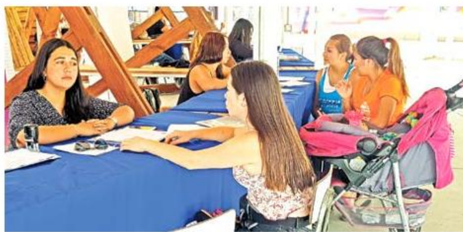
Servicios en terreno. "Cinco Municipios en Terreno tiene programado realizar en marzo la oficina de Organizaciones Comunitarias de la Dirección de Desarrollo Comunitario (Dideco) de Chillán".