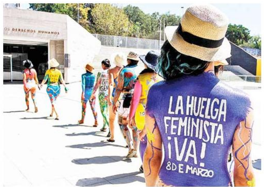
Diversas intervenciones urbanas consideró las actividades de la coordinadora esta semana.

Chile es el quinto país con mayor brecha salarial. 600 mil pesos es el sueldo promedio de los hombres y 410 mil el de mujeres.