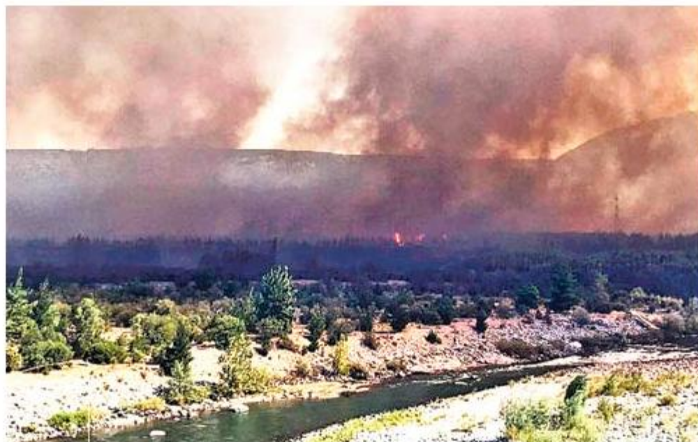
Las autoridades decretaron Alerta Amarilla para las comunas de Coihueco y San Fabián.

POR: LA DISCUSIÓN *diario@ladiscusion.cl