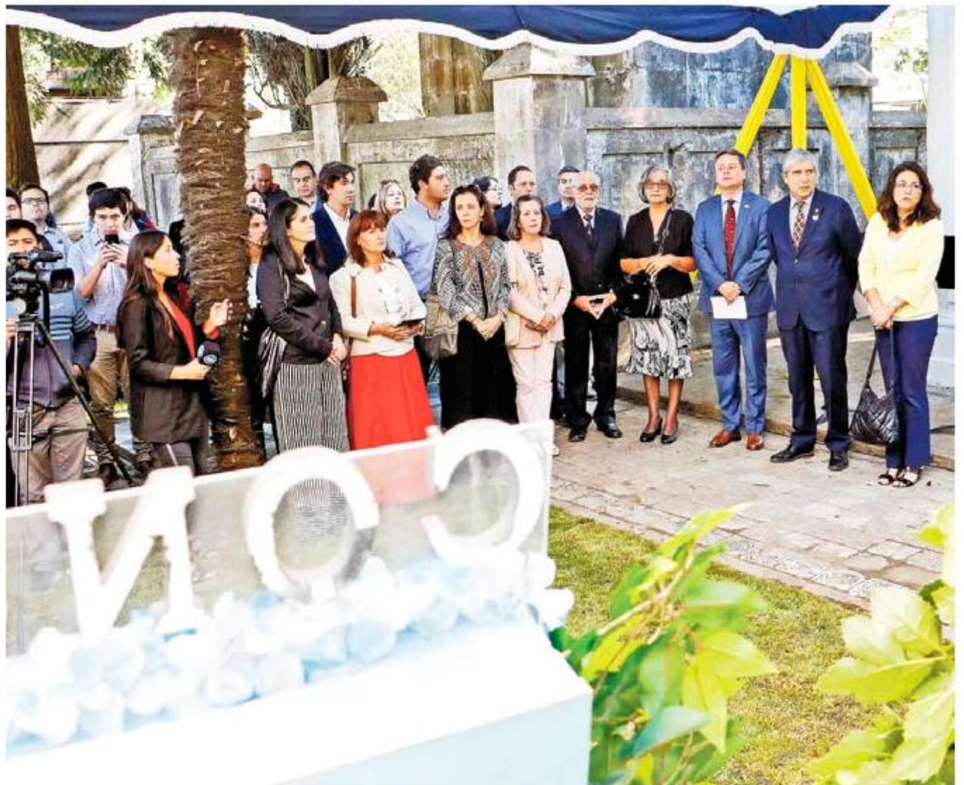
Autoridades universitarias y académicos participaron de la romería.

será la bienvenida de los alumnos de la Generación Centenario.