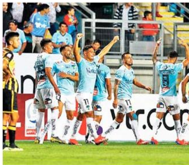
O'Higgins celebró ante Coquimbo en el inicio de la fecha.

Con el triunfo, el cuadro Celeste suma 9 puntos y es puntero del torneo.