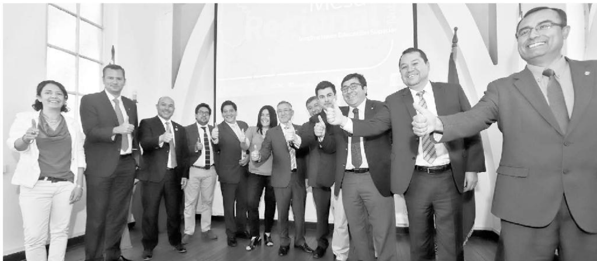
Representantes de las casas de estudios dieron una señal de unidad y convicción en objetivos comunes.

POR: MATÍAS LAGOS *diario@ladiscusion.cl