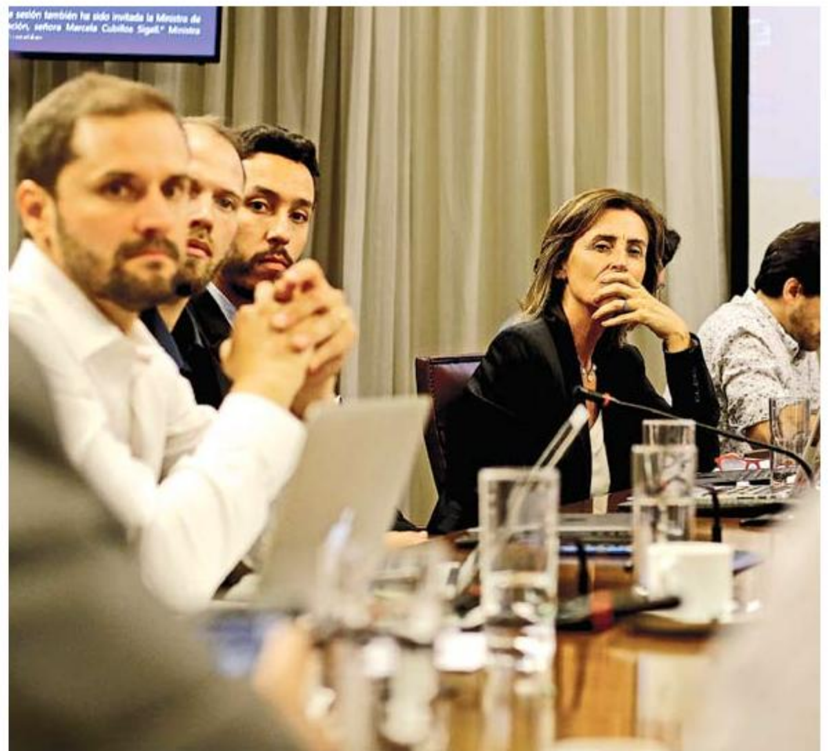
La ministra de Educación, Marcela Cubillos, criticó el proyecto anunciado por diputados opositores.

"Lo hemos denominado eufemísticamente como 'ley Machuca', recordando la ex-