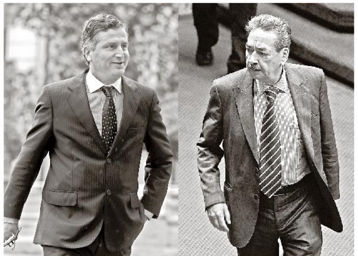
Los parlamentarios rechazaron las críticas y defendieron las votaciones de proyectos del Ejecutivo.

El Frente Amplio informó ayer que seguirá el diálogo solo "con algunos".