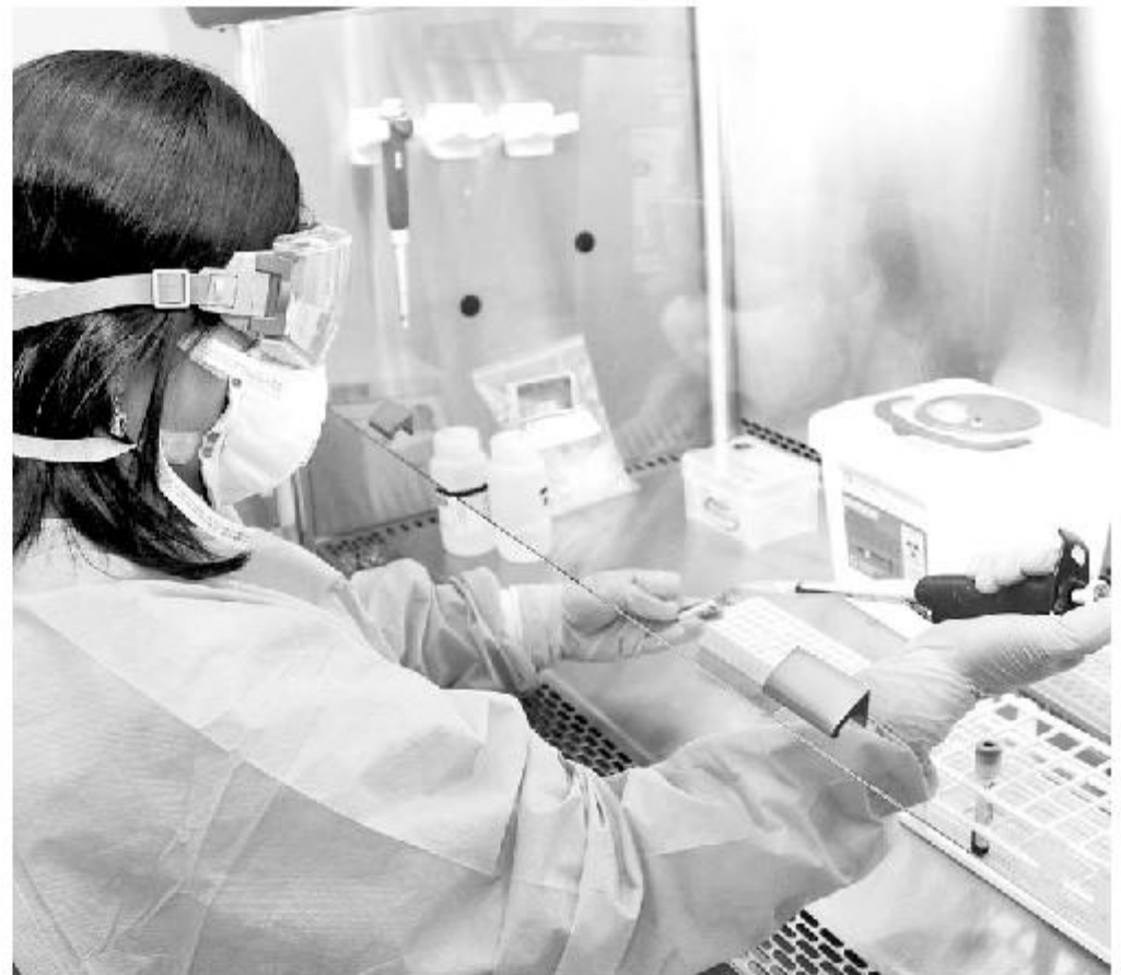
Los gobiernos regionales buscan financiar la vacuna para aplicarla en humanos.

5 las regiones que presentan la mayor presencia del ratón de cola larga.