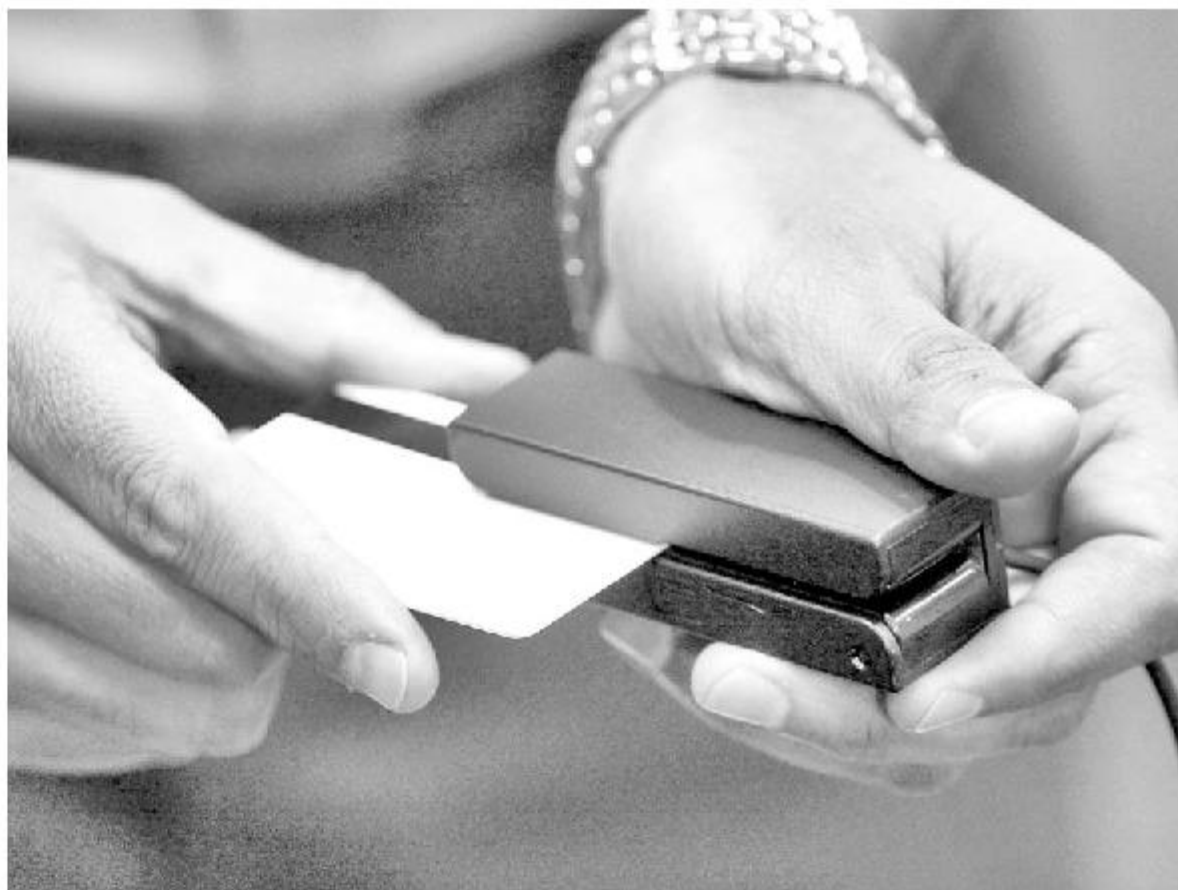
La justicia dispuso el pago de la compensación al afectado por medio de la Ley de Protección al Consumidor.

POR: CLAUDIO GONZÁLEZ *diario@ladiscusion.cl