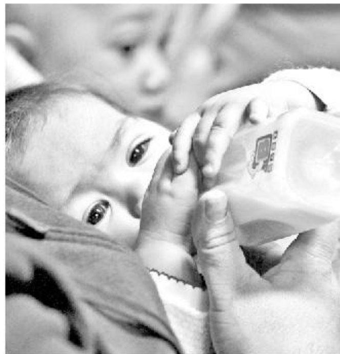
Los beneficiarios deben acercarse a su centro de salud.